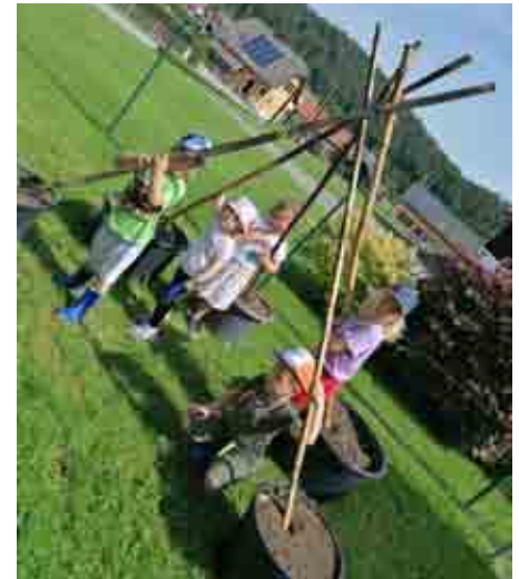
ein Tipi bauen