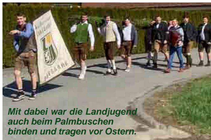
Mit dabei war die Landjugend auch beim Palmbuschen binden und tragen vor Ostern.