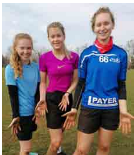
Training in Porec