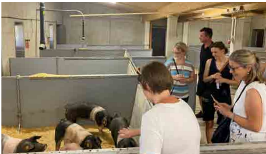
Die TeilnehmerInnen im Tierwohlstall bei Jaga's Steirerei.

bau und Landesweingut Silberberg mit ihren umfassenden Nachhaltigkeitsaktivitäten und dem Zentrum der Steiermark-Mehrwegweinflasche ( https://www.silberberg.at/ ).