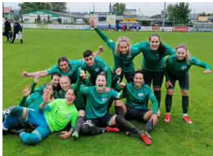
Sieg gegen Liebenau

(teilweise unfreiwillig) ließen wir den Abend bei angenehmen Temperaturen ausklingen.