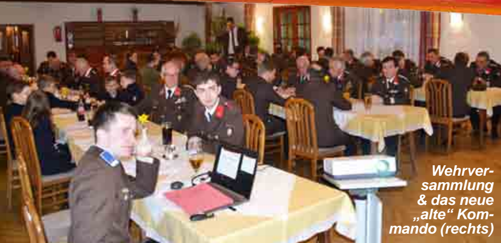
Wehrver- sammlung & das neue „alte“ Kom- mando (rechts)