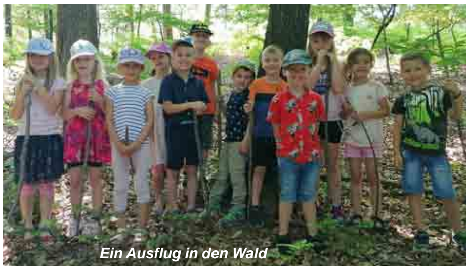
Ein Ausflug in den Wald