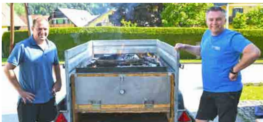
Kistenfleisch bei der Technischen Hilfeleistungsprüfung

Auch dieses Jahr beteiligte sich die FF Oberhaag, neben zahlreichen anderen Feuerwehren, der Polizei und der Rettung, beim jährlichen Welschlauf und sorgte entlang der Laufstrecke für die Sicherheit der Teilnehmer. Trotz des schlechten Wetters nahmen viele Läufer die Herausforderung an und bewältigten den schweren Lauf von Wies nach Ehrenhausen an der Weinstraße.