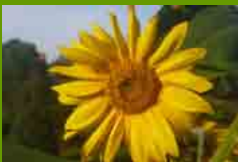
Sonnenblumen wenden sich immer der Sonne, dem Licht zu.

Dieses Buch ist dem Seelen-, Familien- und Weltfrieden gewidmet