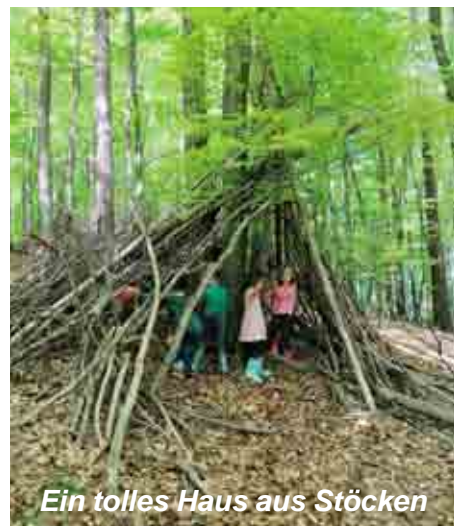
Ein tolles Haus aus Stöcken