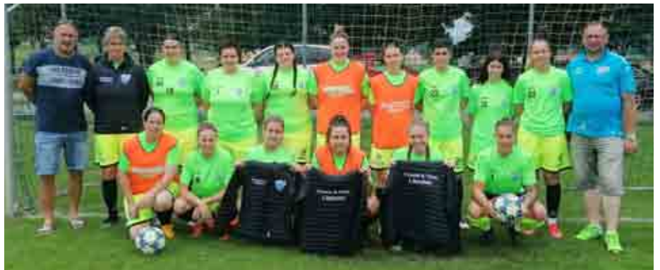
Sponsoring Fenster & Türen Löscher

Voller Stolz können wir auf eine Wahnsinns-Saison zurückblicken! Von 16 Spielen konnten wir zwölf Siege verbuchen und uns somit den Vizemeistertitel sichern. Besonders war die Leistung auf heimischem Boden, wo wir in sieben von acht Spielen voll punkten konnten. Aber ohne unsere treuen Fans, die uns immer voll unterstützen, wäre dies nicht möglich gewesen, denn das eine oder andere Spiel war schon sehr intensiv, doch wir wurden immer wieder gepusht. Danke für eure tolle Unterstützung und wir hoffen, dass ihr uns auch in der nächsten Saison voller Begeisterung vorantreibt.