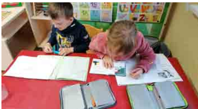
Auch im Kindergarten wird schon eifrig gelernt.