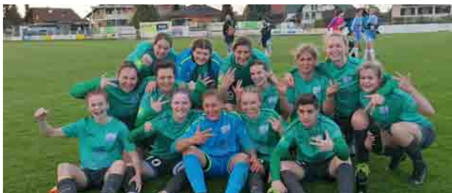
Sieg gegen 1. FC Leibnitz