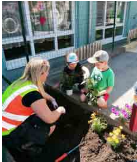
... und noch ein paar mehr