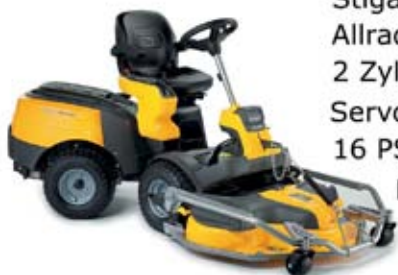
Stiga Park 340PWX Allrad 2 Zylinder Motor Servolenkung 16 PS Mähdeck 100cm elektrisch 6.290,-