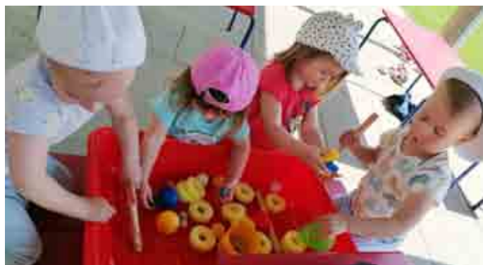
Wasserspiele im Garten