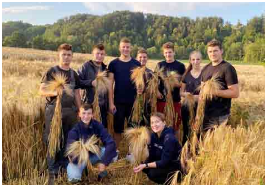
Getreideschneiden für die Erntedankkrone

Für den Welschlauf 2022 durften wir die Medaillen für die Läuferinnen und Läufer herstellen und, um im Herbst wieder eine schöne Erntedankkrone präsentieren zu können, trafen wir uns zum alljährlichen Getreideschneiden.