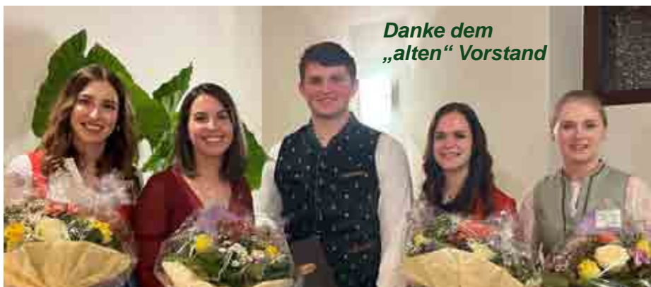
Danke dem „alten“ Vorstand

Ihr Lieben, wir bedanken uns im Namen aller Mitglieder für euren jahrelangen Einsatz. Ihr habt großartiges geleistet und mit euren tollen Ideen und Umsetzungen die Landjugend ein Stück weitergebracht. Vielen Dank!