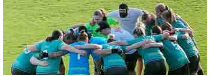
Ein Kreis des Vertrauens