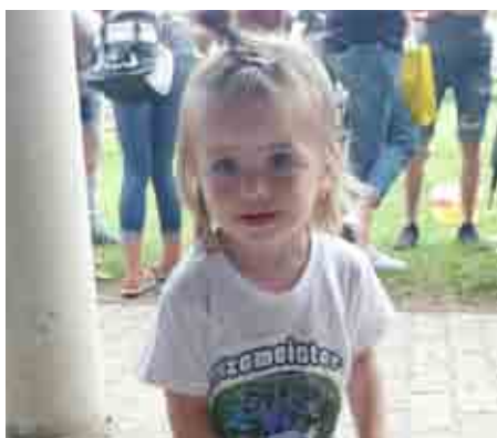
Unser jüngstes Nachwuchstalent