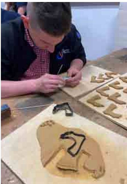
Medaillen für den Welschlauf

Für den Welschlauf 2022 durften wir die Medaillen für die Läuferinnen und Läufer herstellen und, um im Herbst wieder eine schöne Erntedankkrone präsentieren zu können, trafen wir uns zum alljährlichen Getreideschneiden.