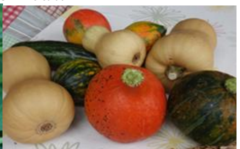
Bio-Hokkaido- und -Butternusskürbisse