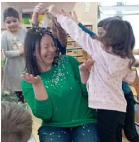
Konfettiregen für das Geburtstagskind