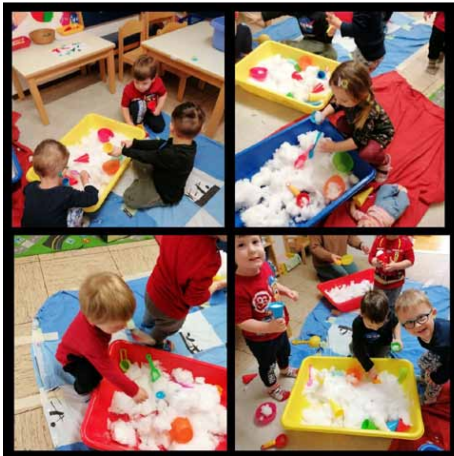
Spiele und experimentieren mit Schnee