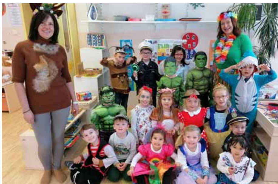
Kreative Kostüme im Sonnenland