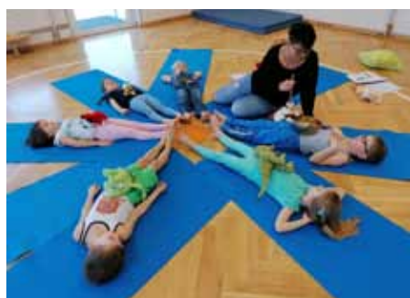
Eine tolle Entspannungseinheit