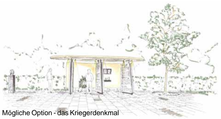
Mögliche Option - das Kriegerdenkmal