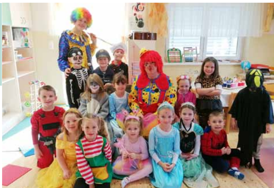
Tolle Verkleidungen im Regenbogenland