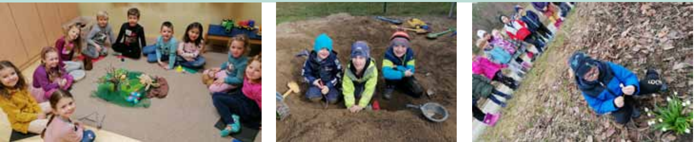
Ein Farbenprojekt in der Kinderkrippe