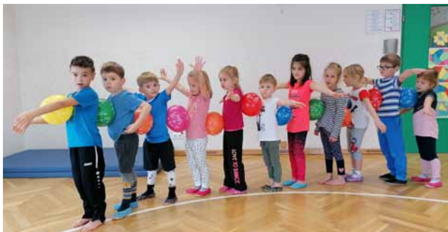
Bewegungseinheit mit Luftballonen