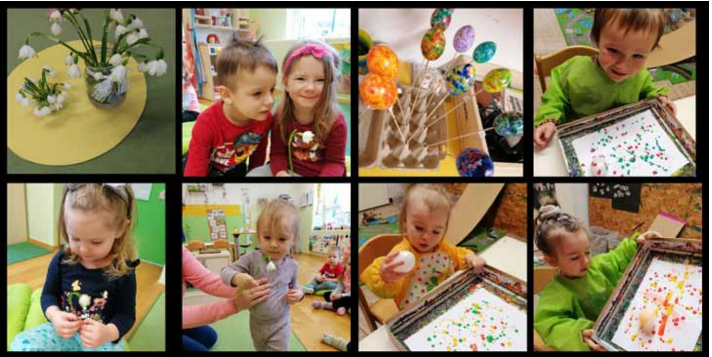
Frühling / Ostern