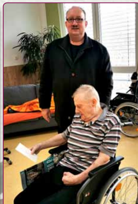
Drei „Geburtstagskinder“ aus dem Pflegeheim