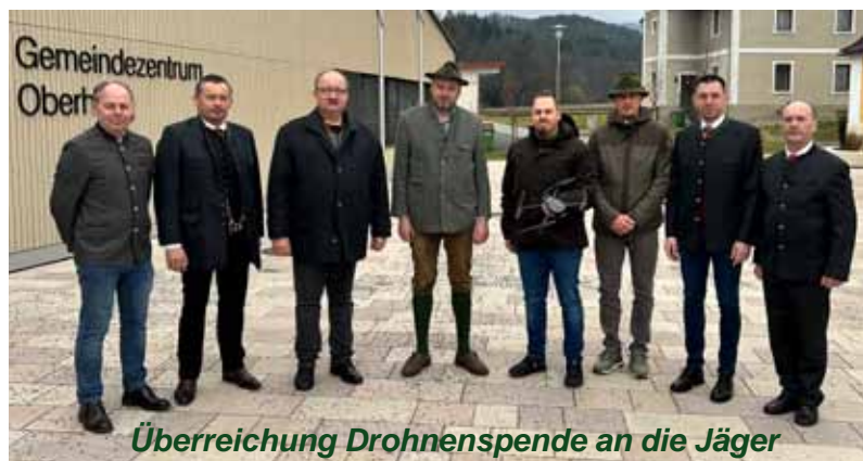
Überreichung Drohnenspende an die Jäger