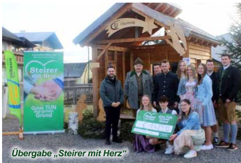
Übergabe „Steirer mit Herz“