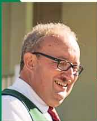
Bürgermeister Ernst Haring Landwirt Oberhaag