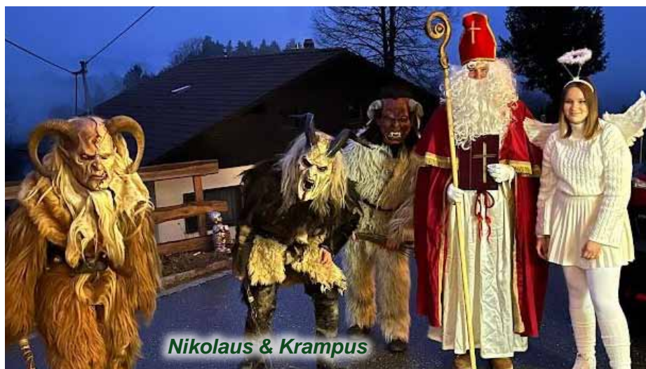
Nikolaus &amp; Krampus