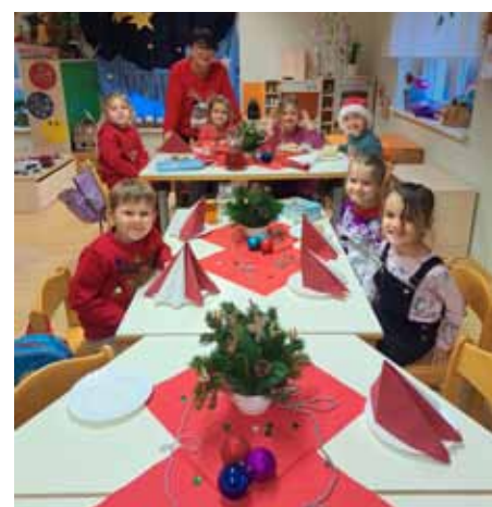
Eine schön geschmückte Tafel zur Weihnachtszeit