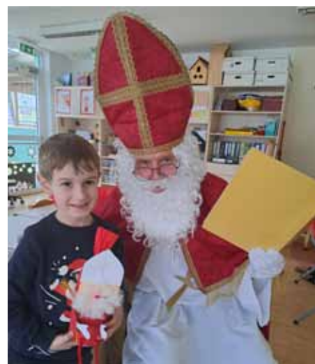
Für jedes Kind gab es ein Geschenk vom Nikolaus