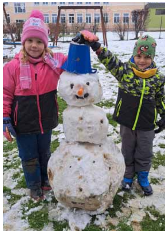
Ein Schneemann wurde gebaut.