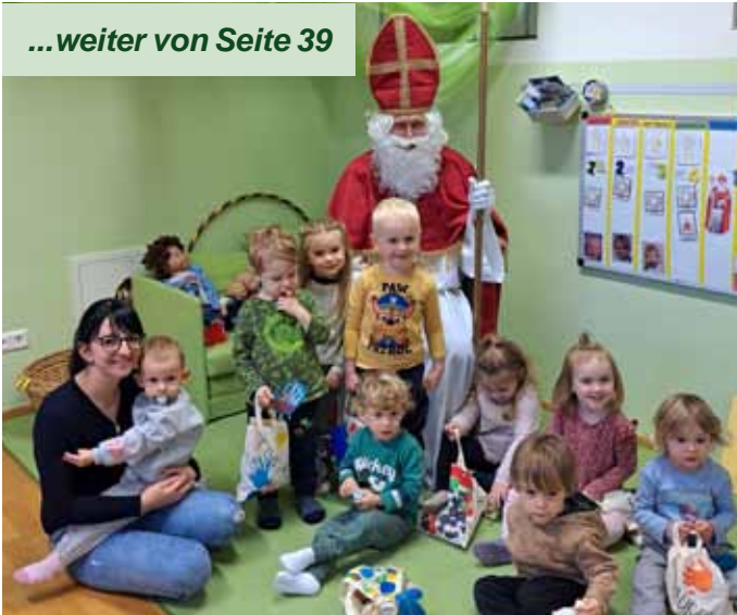
Besuch des Heiligen Nikolaus in der Kinderkrippe