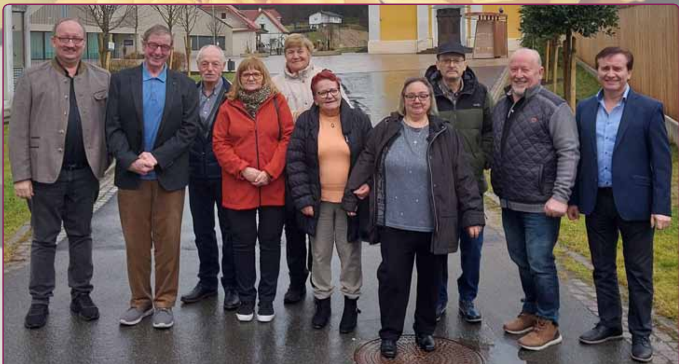
Gemeinsame Geburtstagsfeiern der 70er, 80er und 90er