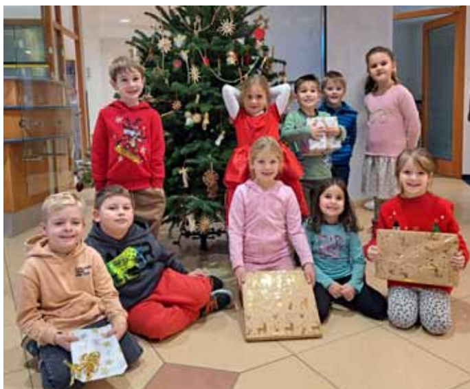
Christbaum schmücken in der Raiffeisenbank