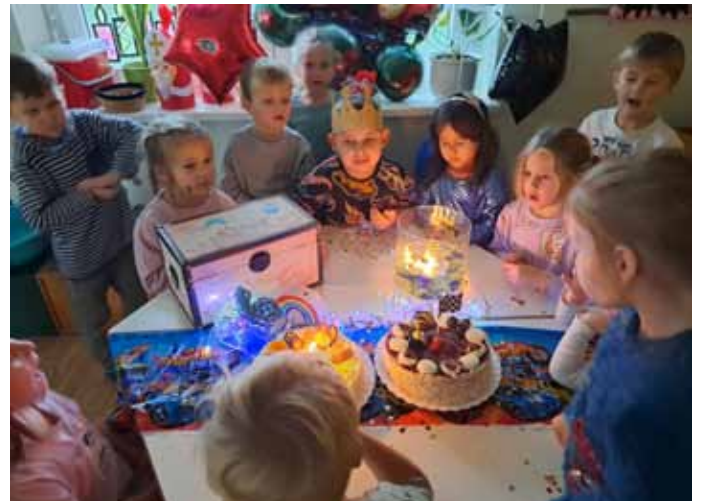
Happy Birthday! Wir feiern Geburtstag...

Durch Spaziergänge, Bob fahren, spielen und toben in unserem Garten konnten die Kinder den Schnee mit all ihren Sinnen erleben und wahrnehmen. Sie hatten dabei eine Menge Spaß. Bei verschiedenen Experimenten zum Thema Schnee und Eis wurde die Neugier der Kinder geweckt. Dabei konnten sie viel entdecken und erkunden.