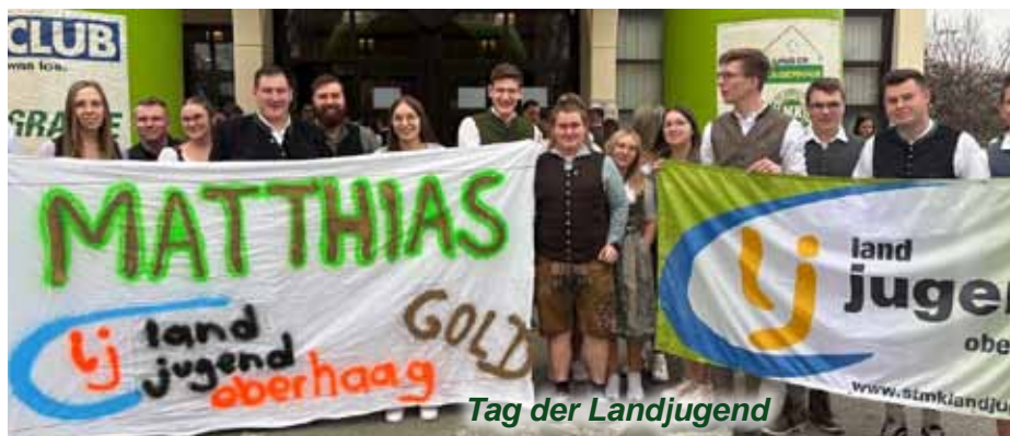
Tag der Landjugend