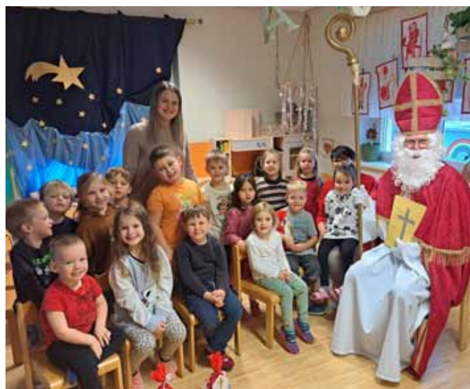
Besuch des Heiligen Nikolaus