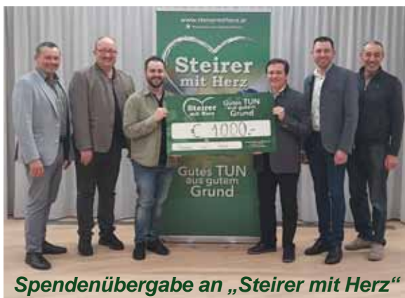
Spendenübergabe an „Steirer mit Herz“