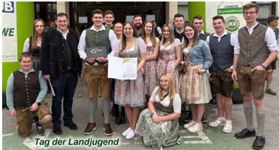
Tag der Landjugend