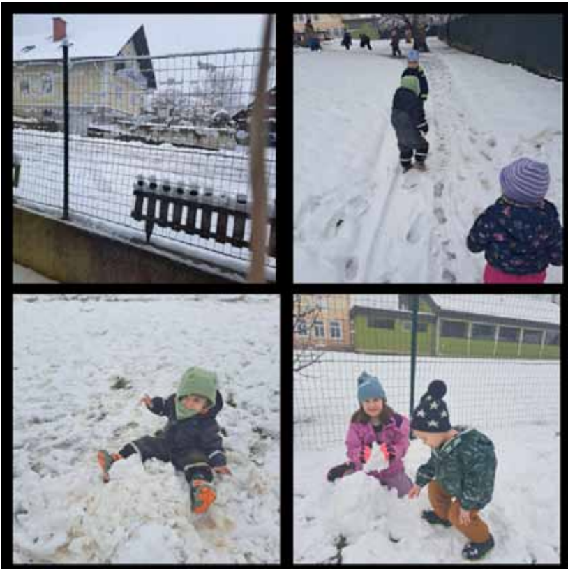
Juhuu, endlich Schnee!